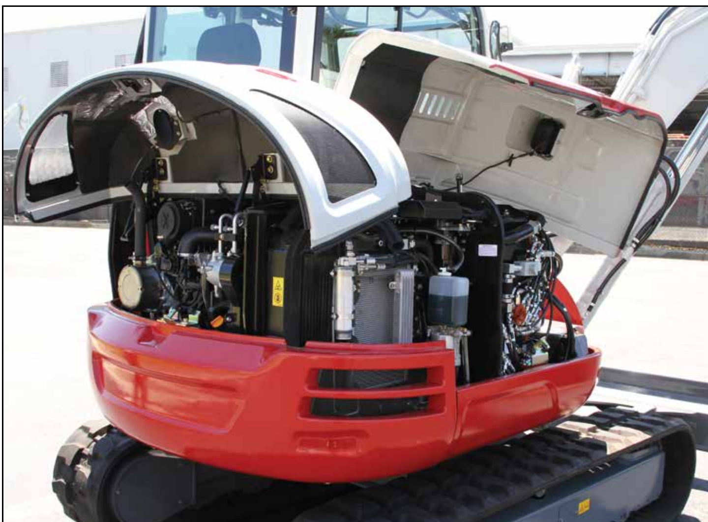
Stora, låsbara servicehuvor ger vandalskydd och enastående åtkomst för underhåll

Maskinen har en interiör med hög förarkomfort och pilotstyrda reglage, körreglage med stora pedaler, lättåtkomliga vippbrytare och gasreglage i form av en vridpotentiometer.