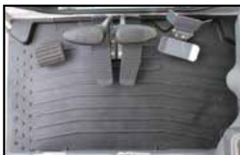
Rymligt golv med fotstöd