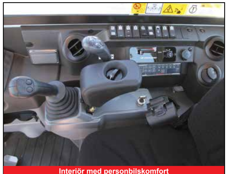
Interiör med personbilskomfort

*Funktionerna är eventuellt inte tillgängliga i alla länder. Kontakta din Takeuchi-återförsäljare för mer information.