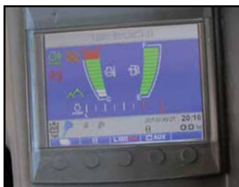
Display i hytt