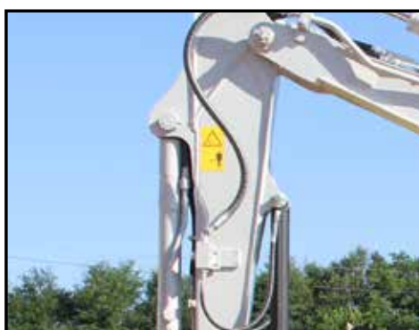
2 st hydraulkretsar